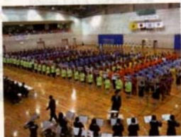
大阪府堺市で開かれた「JOCジュニアオリンピックカップ」

と、岩手の中学生のハンドボールの実力は東北トップ。近くに練習相手がないので関東に遠征したり、強豪の高校チームに胸を借りたりと、着実に練習を