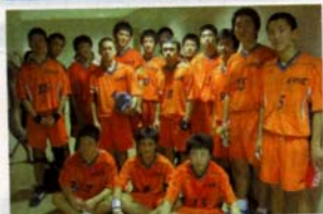
岐阜選抜戦、勝利の後で。岩手選抜男子のメンバー

この大会は、将来の日本ハンドボール界を背負って立つような有望選手の発掘を目的に開かれたもので、参加したのは全国のプロック予選を勝ち抜いた男女各16チーム。見事、東北代表の座を得たのは、男女とも岩手でした。 選抜男子は城西中と矢巾中、女子は矢巾北中と矢巾中のメンバーを中心にチームを編成。以前このコーナーで紹介したハンドボールのスポ少「リトルハ